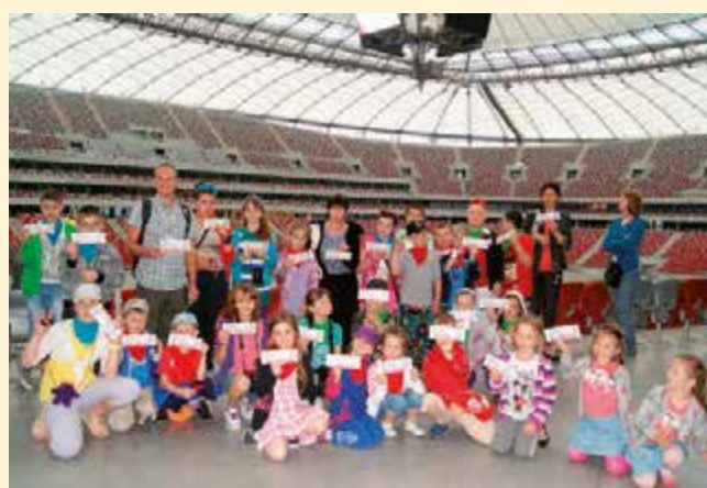
Wycieczka do Warszawy z projektu „Akademia wielkich możliwości”