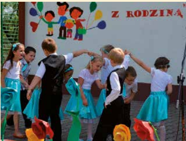
Młodsza grupa taneczna „Czerwone Jagódki”