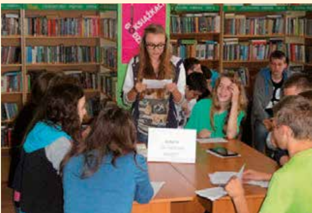
Debata „Za i przeciw książce” – swoich przekonań bronili gimnazjaliści