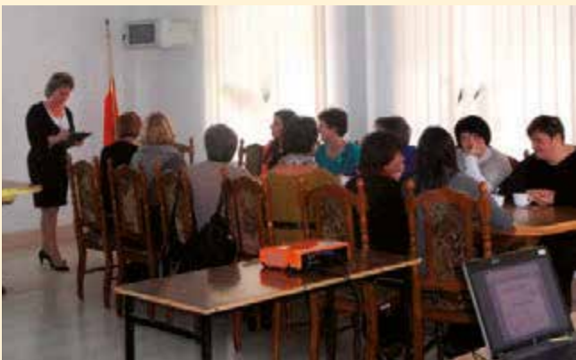
Spotkanie partnerskie bibliotek