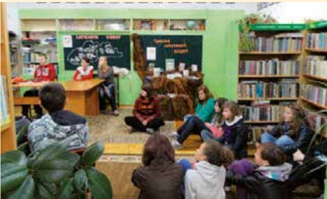
Tydzień zakazanych książek z udziałem uczniów z gimnazjum