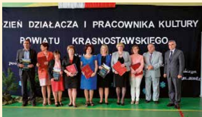
Pracownicy biblioteki odbierają podziękowania za działalność kulturalno- oświatową w Dniu Działacza i Pracownika Kultury w Kraśniczynie