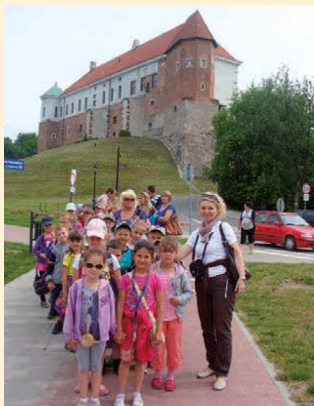
Wycieczka do Sandomierza