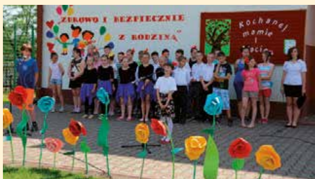
Festyn rodzinny 2014 „Zdrowo i bezpiecznie z rodziną”