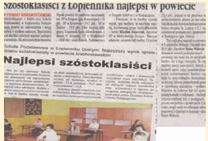
O naszych sukcesach informowała prasa lokalna

W roku 2012 dyrektor szkoły wraz z gronem pedagogicznym zorganizował zjazd najstarszych absolwentów szkoły, a dokładnie uczniów klas I i II z roku 1938.