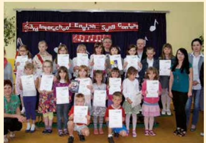
Uczestnicy III Międzszkolnego Konkursu Piosenki Angielskiej - klasy I-III

Szkoła w Łopienniku Dolnym jest sześcioklasową szkołą podstawową z oddziałem przedszkolnym. Do jej obwodu należą miejscowości: Łopiennik Dolny, Łopiennik Podleśny, Borowica, Dobryniów, Dobryniów – Kolonia, Żulin, Wola Żulińska. Budynek szkolny mieści 7 sal lekcyjnych, pracownię komputerową, świetlicę, stołówkę i szatnię. Wszystkie pomieszczenia są nowoczesnie umeblowane ze stolikami i krzesłkami dostosowanymi do wzrostu uczniów. Placówka jest bardzo dobrze wyposażona w pomoce dydaktyczne oraz sprzęt. Posiada tablice interaktywne, komputery stacjonarne, laptopy, projektory multimedialne, drukarki i kserokopiarki, telewizory, odtwarzacze DVD i CD.