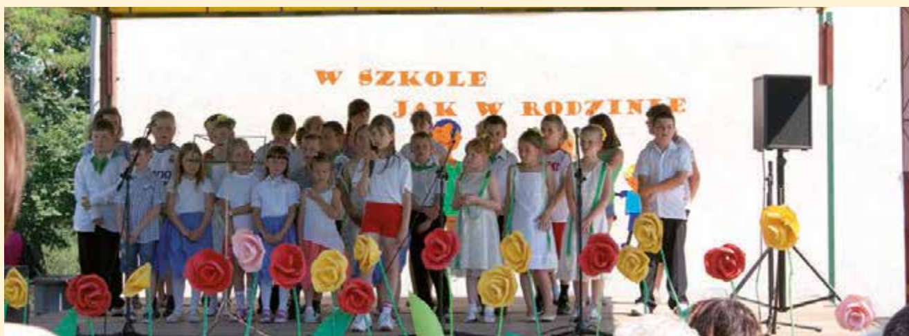
Festyn rodzinny 2012 „W szkole jak w rodzinie”