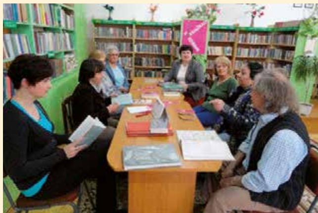
Spotkanie Dyskusyjnego Klubu Książki