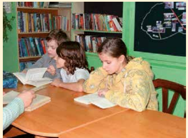
Lekcja biblioteczna „Klubu odkrywców” z Zespołu Szkół w Łopienniku Nadrzecznym