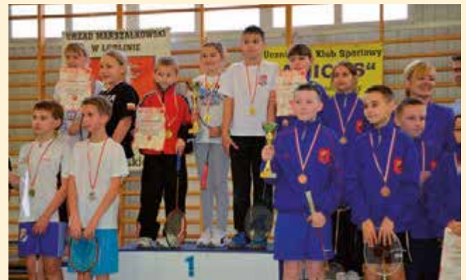
Medaliści na podium