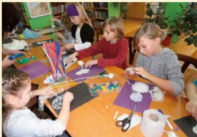
Zajęcia artystyczne w bibliotece w czasie dni wolnych od nauki