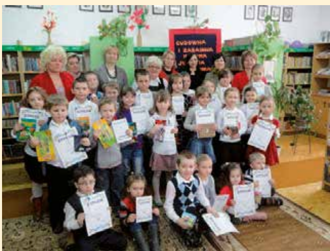
Konkurs recytatorski „Cudowna kraina Juliana Tuwima” z udziałem dzieci z okolicznych szkół