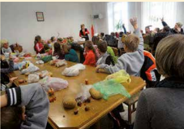
Historia ziemniaka, gry i zabawy z ziemniakami, frytki i placki to Święto Pieczonego Ziemniaka z udziałem najmłodszej grupy dzieci ze Szkoły Podstawowej w Łopienniku Dolnym.