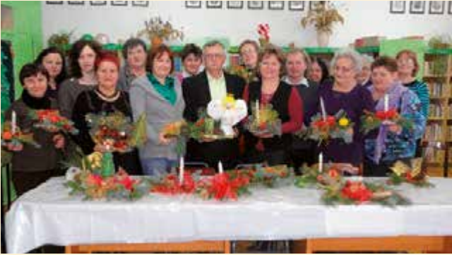
Wspólne zdjęcie uczestników warsztatów bożonarodzeniowych