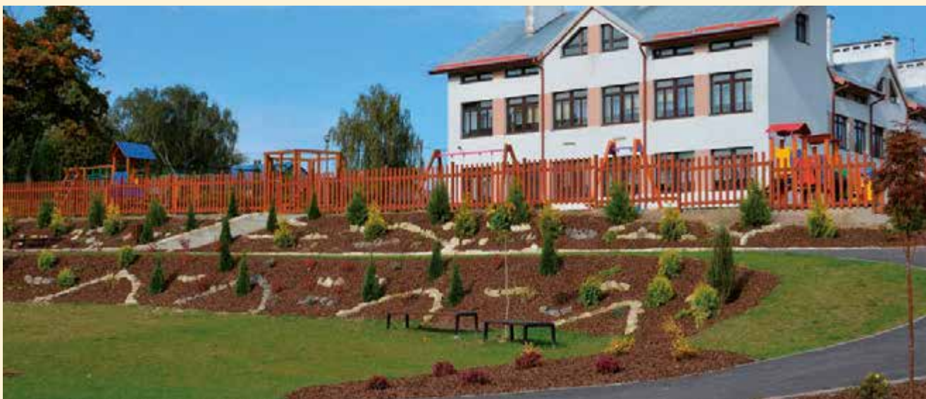
Skwer gminny w Łopienniku Nadrzecznym