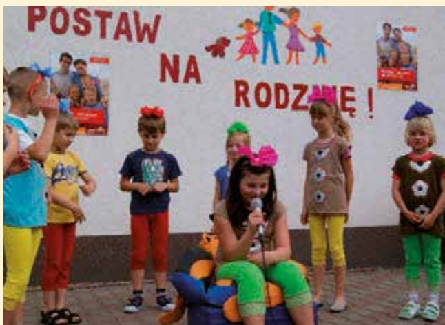
Festyn rodzinny 2011 pod hasłem „Postaw na rodzinę”