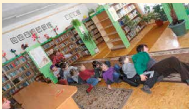
Ferie zimowe w bibliotece – inscenizacja „Rzepki”