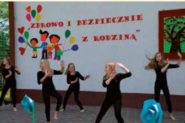
Taniec sportowy w wykonaniu zespołu tanecznego

czyły do szkoły w porze zimowej - przez sześć lub siedem miesięcy. Nauka odbywała się tylko w języku rosyjskim.