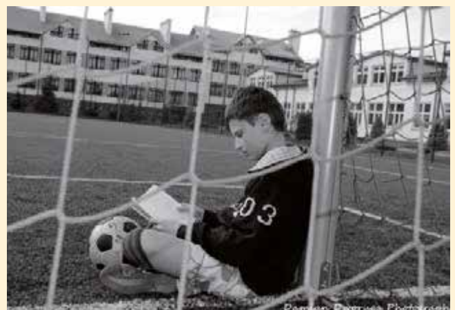
Nagrodzone zdjęcie w konkursie fotograficznym „Przyłapani na czytaniu”