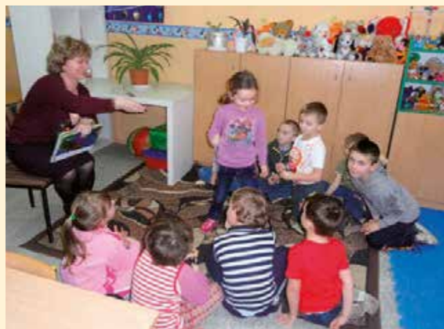
Z wizytą w Niepublicznej Szkole Podstawowej w Żulinie