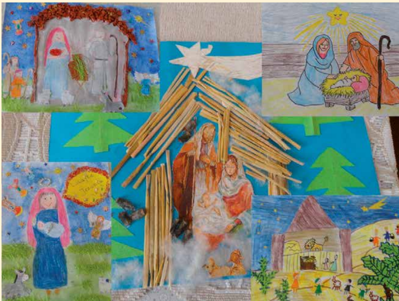
Konkurs plastyczny „Najpiękniejsza kartka świąteczna”