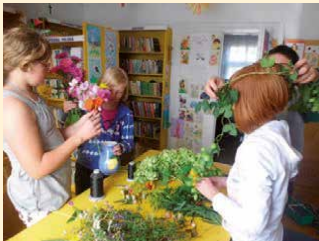
Inscenizacje – Dożynki, wicie wianków