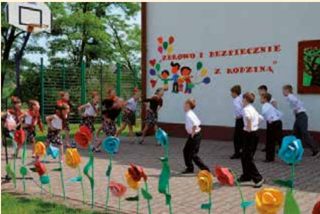
Roztańczone i rozśpiewane „Słowińskie nutki”- zespól taneczny