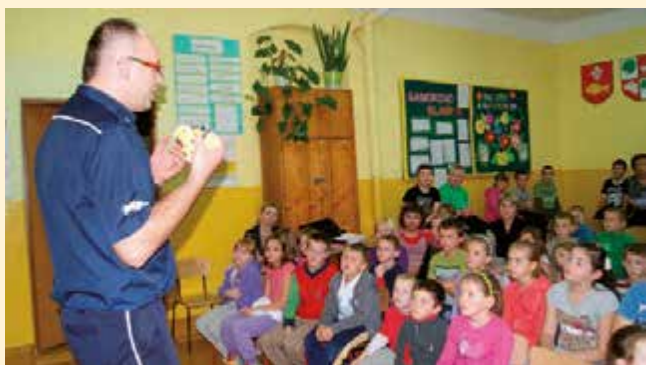
Spotkanie z policjantem