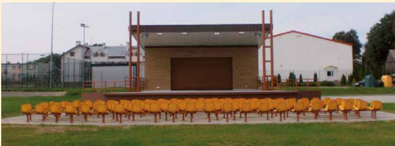
Amfiteatr w Łopienniku Nadrzecznym