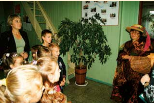
Jesień w literaturze. Pożegnanie lata -powitanie jesieni z udziałem dzieci ze Szkoły Podstawowej w Łopienniku Dolnym