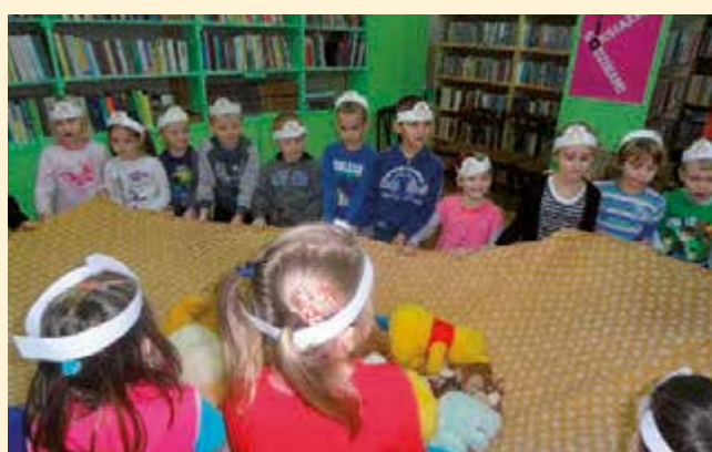
Światowy Dzień Pluszowego Misia – spotkanie z maluchami