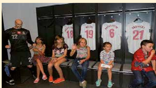
Wycieczka do Warszawy