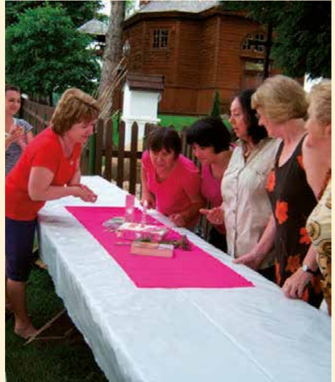
I urodziny Dyskusyjnego Klubu Książki – spotkanie w Borowicy z Towarzystwem Przyjaciół Borowicy.