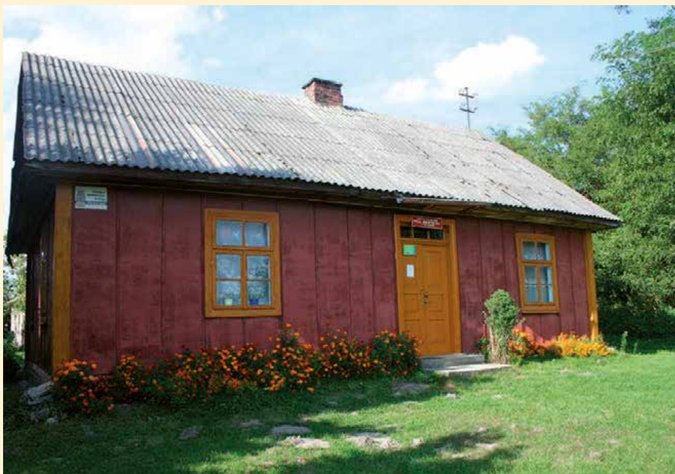
Budynek filii biblioteki