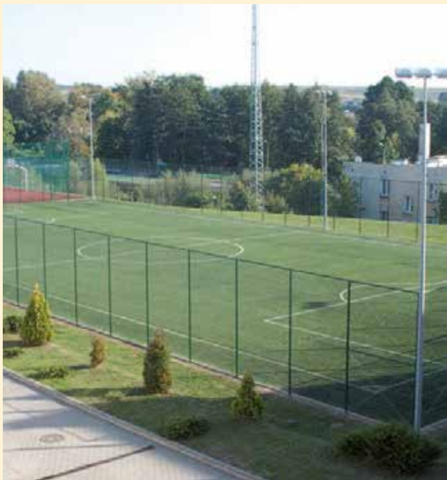
Kompleks boisk ORLIK przy Zespole Szkół w Łopienniku Nadrzecznym