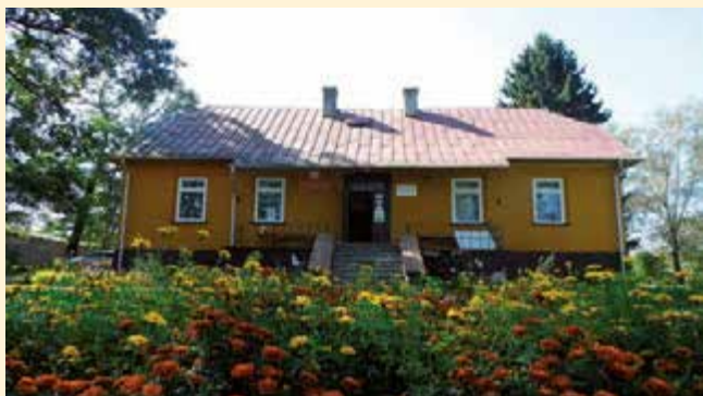
Niepubliczna Szkoła Podstawowa w Żulinie

Niepubliczna Szkoła Podstawowa w Żulinie, szkoła, która powstała z marzenia, rozpoczęła swoją pracę 1 września 2012r.