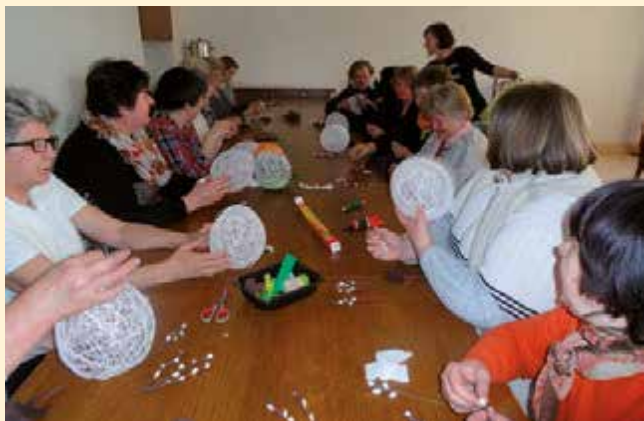
Warsztaty wielkanocne z udziałem przyjaciół biblioteki