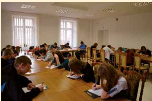
Konkurs ortograficzny z udziałem uczniów gimnazjum

Kampania społeczna, rozpoczęta w czerwcu 2001 przez Fundację „ABCXXI – Cała Polska czyta dzieciom” mająca na celu propagowanie codziennego czytania